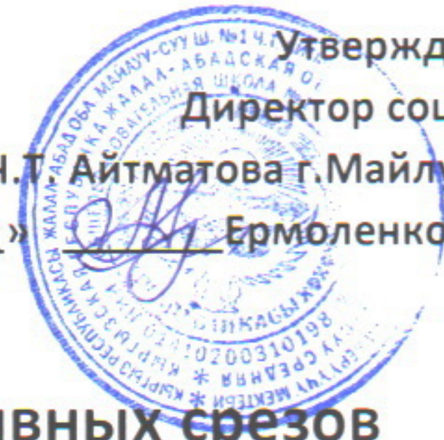
График проведения административных срезов по русскому языку на 2021-2022 учебный год